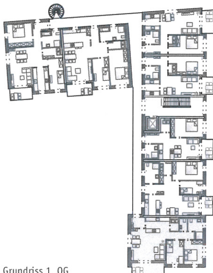
Grundriss 1. OG